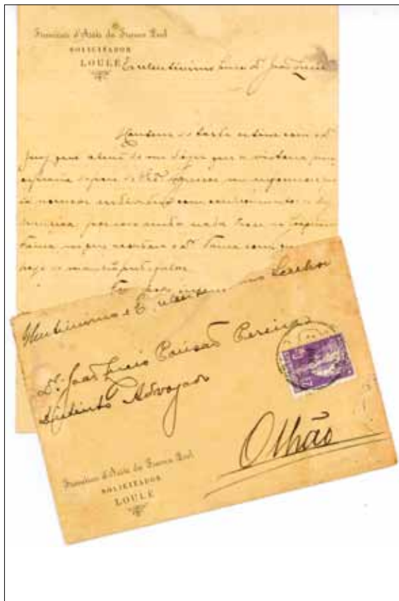
Correspondência Recebida (7 de Junho de 1912).