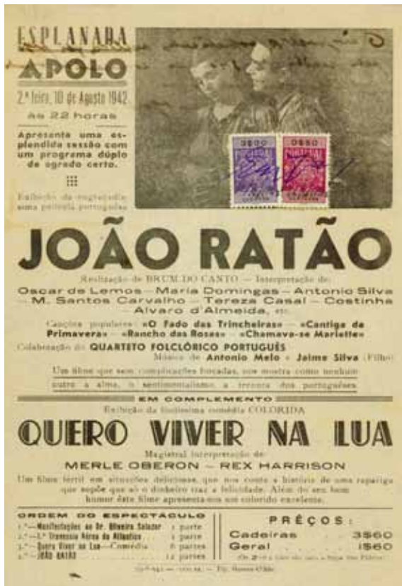
PANFLETO DE DIVULGAÇÃO - 10 de Agosto de 1942

Arquivo Histórico Municipal de Olhão Rua Teófilo Braga n° 45, 47 8700-520 Olhão