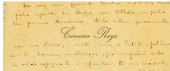
CARTÃO PESSOAL - CORRESPONDÊNCIA RECEBIDA 1923