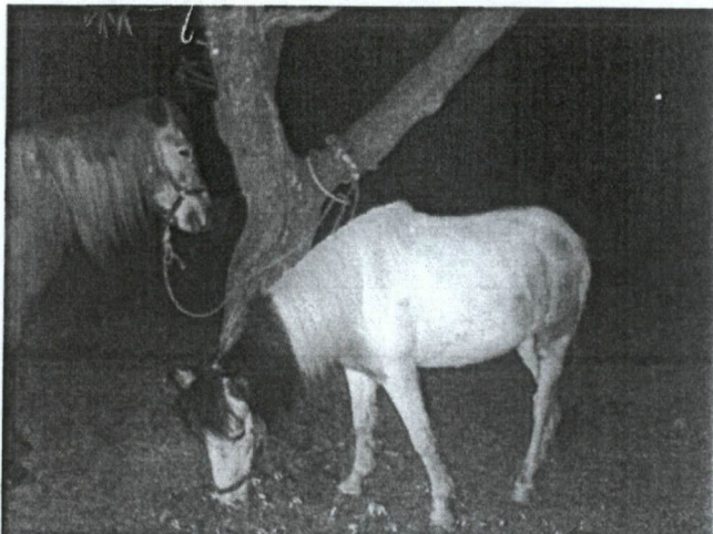
Pormenor do equídeo do sexo feminino (égua) no local, possuidora do chip de identificação nº 900026000209527.