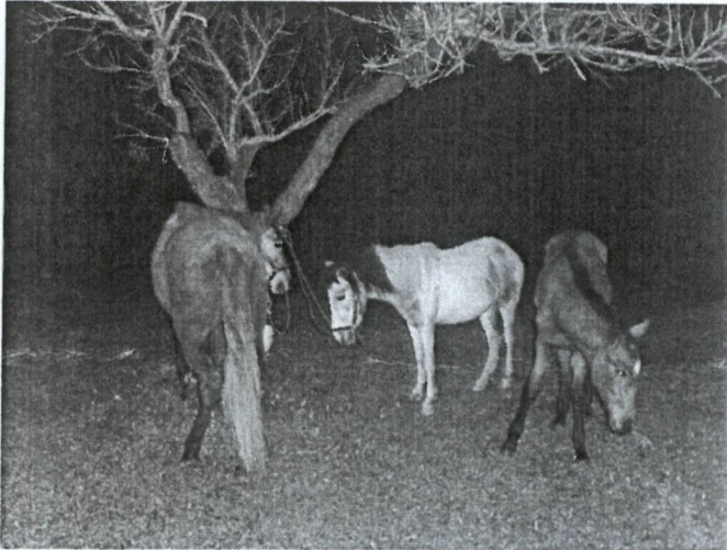
Legenda: Vista geral dos três equídeos.