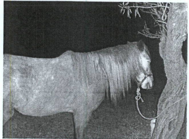
Pormenor do equídeo do sexo masculino no local, possuidor do chip de identificação nº941000013308838.