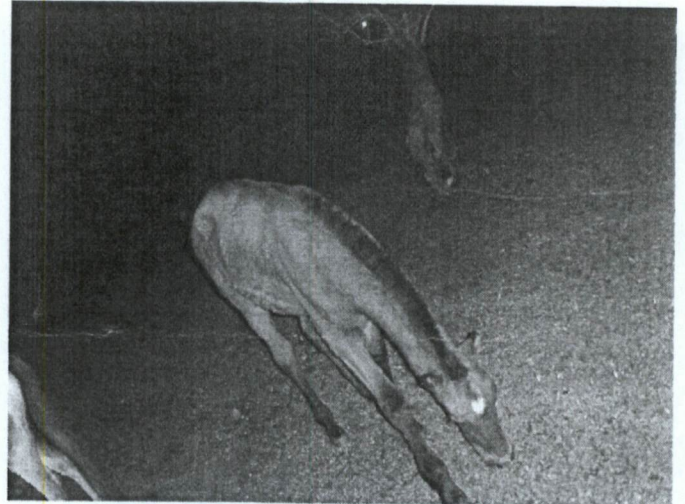
Legenda: Pormenor do equídeo jovem (potro), o qual não possuía chip.