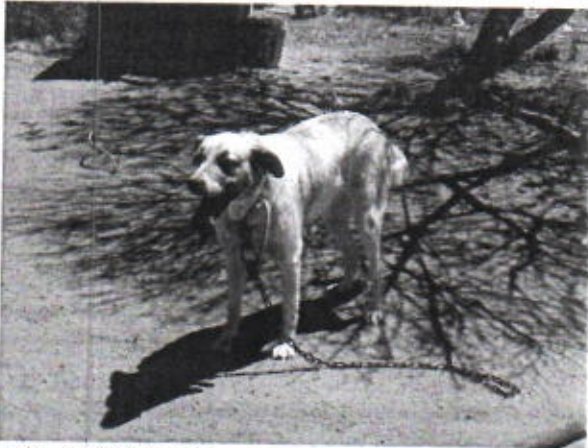
Legenda: Canídeo "Luna"