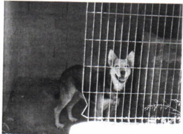
Legenda: Canídeo "Raposinho"