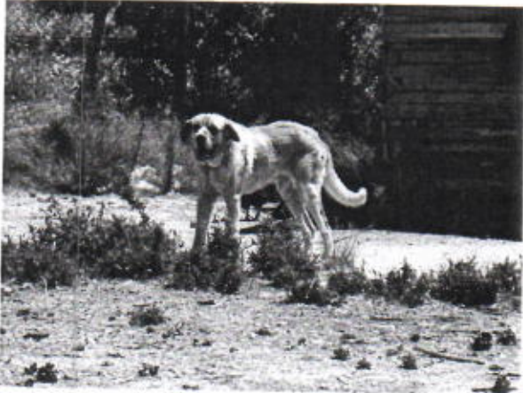
Legenda: Canídeo "Leão"