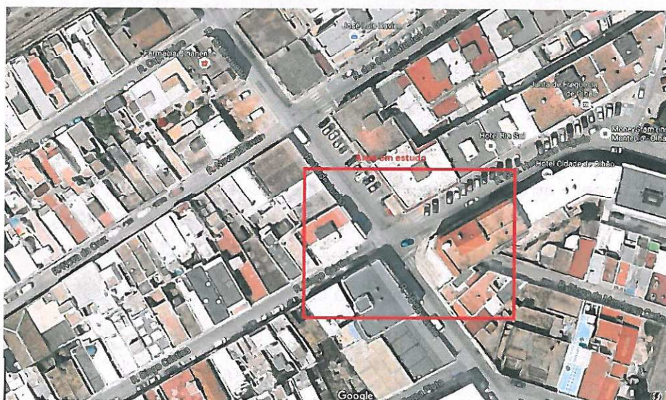
Foto do lugar pretendido

A área estudo consta na imagem seguinte do Google maps