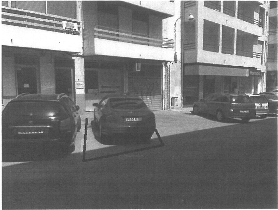
Lugar de estacionamento proposto