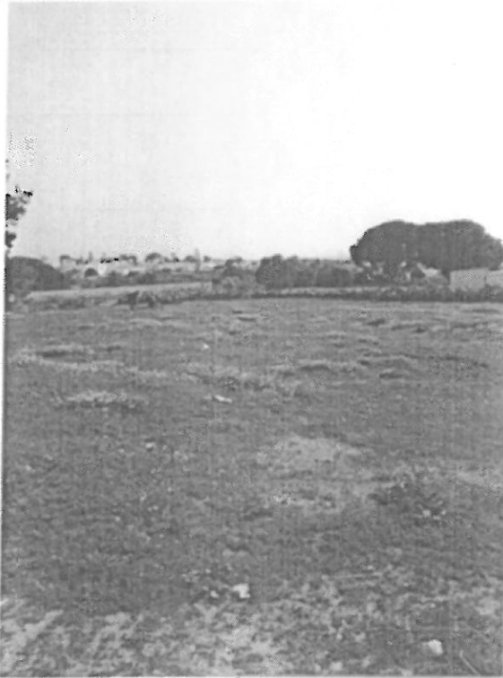
Legenda: Foto Geral do Local