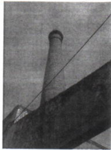
Foto 08 – Fissuração longitudinal acentuada na chaminé industrial