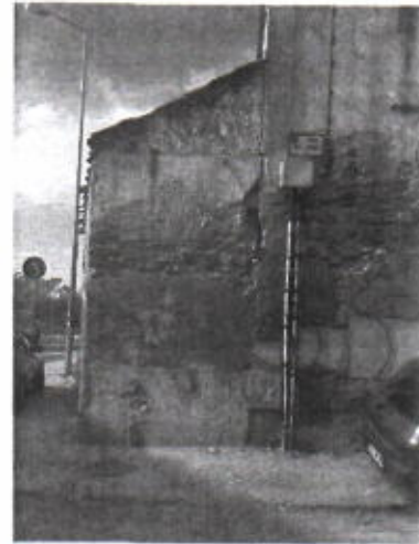
Foto 02 - Fissuração acentuada entre volumes, no alçado tardoz