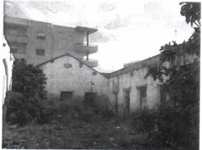
Foto 10 – Cobertura abatida. Acumulação de detritos. Proliferação de vegetação.