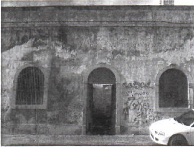
Foto 03 - Vão aberto no alçado tardoz