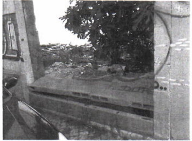
Foto 04 - Vão aberto no alçado principal