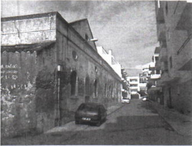
Foto 01 - Rebecos degradados no alçado tardoz