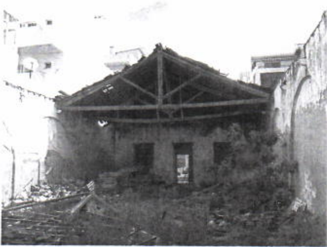
Foto 09 – Cobertura parcialmente abatida. Cobertura em risco de colapso. Acumulação de detritos no interior. Proliferação de vegetação.