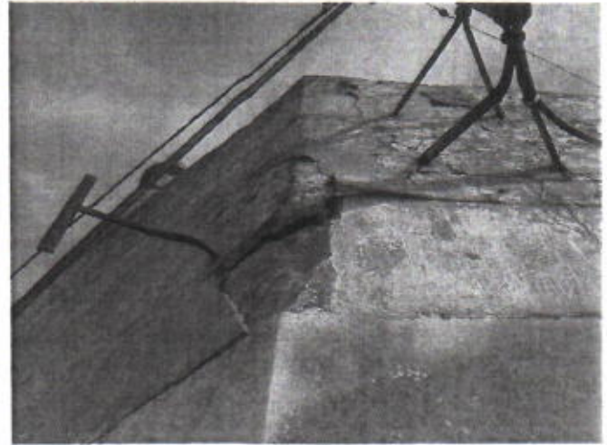
Foto 06 - Desprendimento de reboco nas paredes exteriores