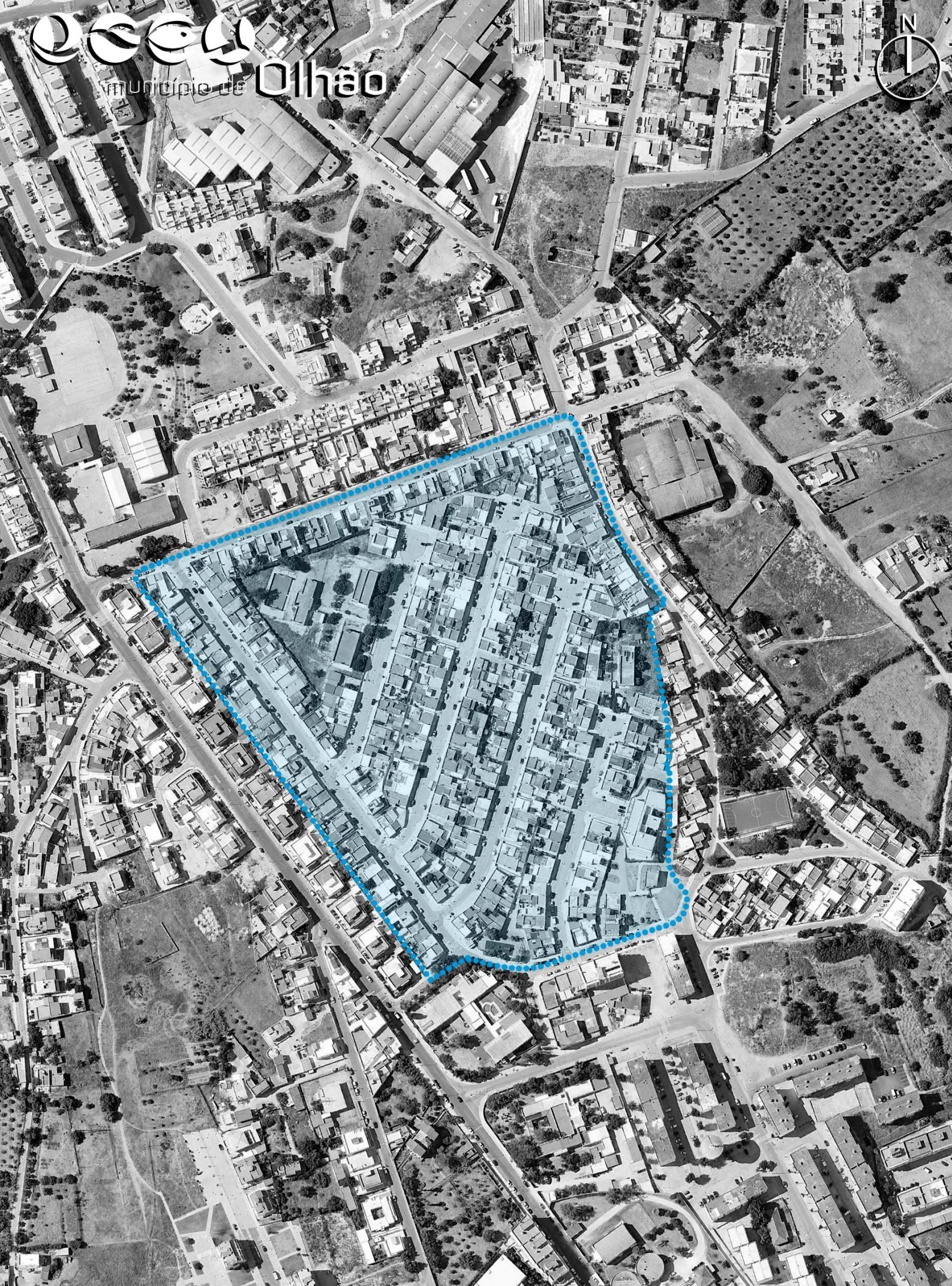
A - BAIRRO 28 DE SETEMBRO - 1946/1951 GPS 37.036850N 7.846987W