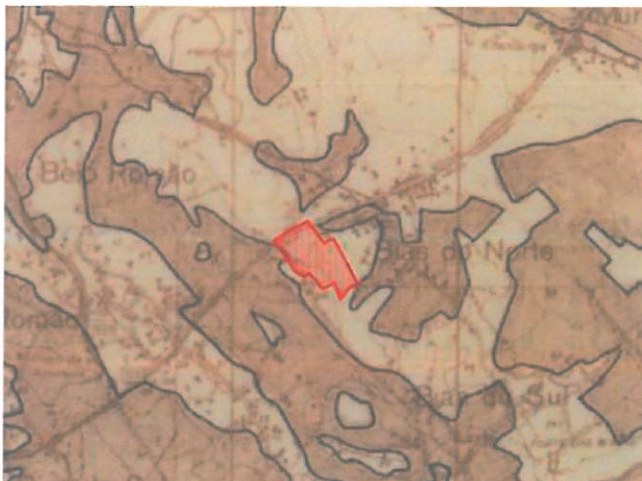
Fig 4 – Extrato da Planta de Condicionantes do PDM - RAN

Apresenta-se no entanto, uma condicionante de linha de água, sendo também integrada na REN.