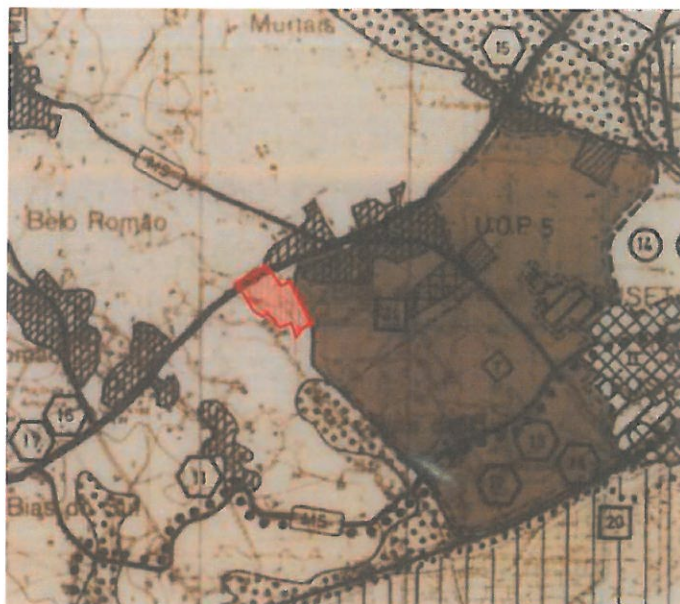
Fig 3 – Extrato da Planta de Ordenamento do PDM

Na Planta de Ordenamento do PDM, o PP abrange a seguinte classe de espaço: