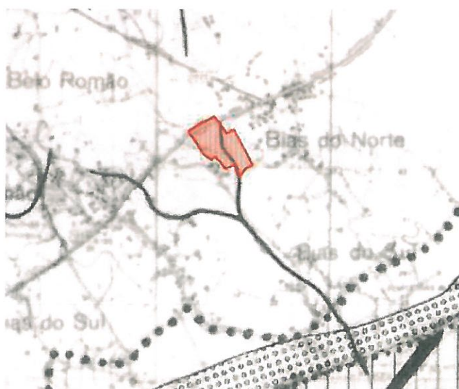
Fig 5 – Extrato da Planta de Condicionantes do PDM – Servidões Especiais

Apresenta-se no entanto, uma condicionante de linha de água, sendo também integrada na REN.