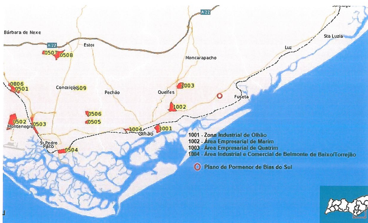
Figura 1 – Localização das áreas empresariais existentes e previstas na área de influência do Plano de Pormenor de Bias do Sul.

Nestes termos, a criação de uma nova área empresarial, ainda que de reduzida dimensão relativa, promovida pela iniciativa privada, afigura-se como uma oportunidade muito interessante para o concelho disponibilizar a curto prazo o espaço de que carece para o estabelecimento de novas empresas, em especial na atividade de logística/armazenamento e nomeadamente para a localização de armazenamento e comércio de materiais de construção, atividade que necessita de uma tipologia de área para a qual não há qualquer oferta no concelho.