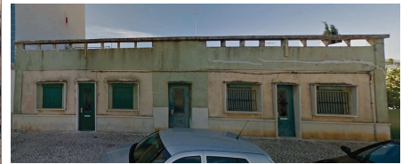
Imagem nº1 - Fachada do edifício do pedido de atribuição do número de policia

Proposta: A presente proposta surge na sequência de um pedido de atribuição de número de policia a um edifício situado na Rua António Simões Júnior, no sítio de Brancanes-freguesia de Quelães, concelho de Olhão.