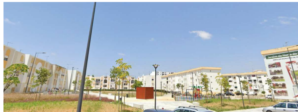
Img 1 - Jardim Capitão José Salgueiro Maia