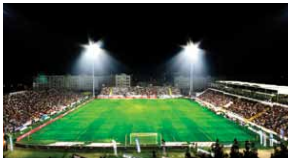
Fotografia gentilmente cedida pelo S.C. Olhanense. Autor: Augusto Viola